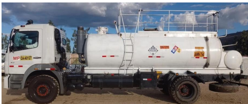
Cisterna de 10 m3