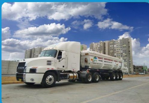
Gestión de residuos peligrosos y no peligrosos