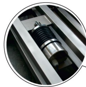
Celda de Carga totalmente protegida contra polvo y agua