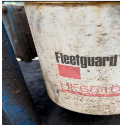
Cambio de filtro en línea