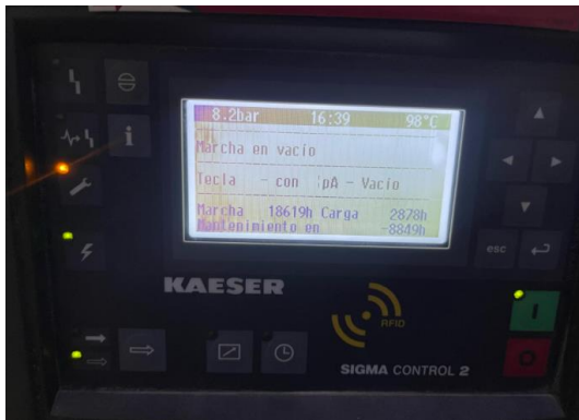
HORAS DE TRABAJO DE COMPRESOR