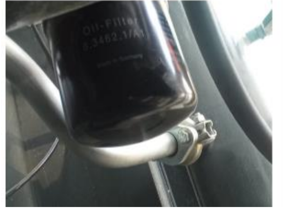
MUESTRA DE FILTRO DE ACEITE