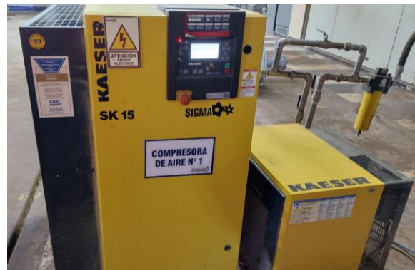
GABINETE DE EQUIPO