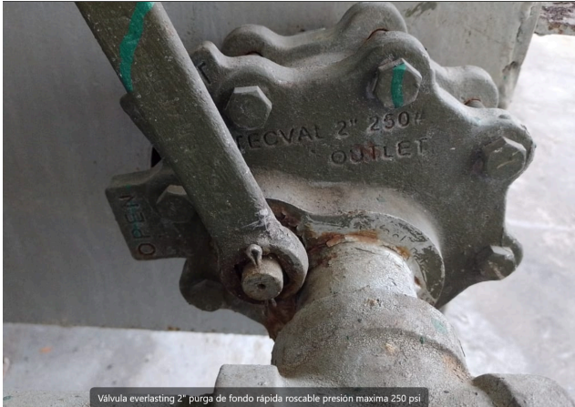
Valvula everlasting 2" purga de fondo rápida roscable presión máxima 250 psi

adjunto fotos referenciales de las que se encuentran instaladas en nuestra caldera