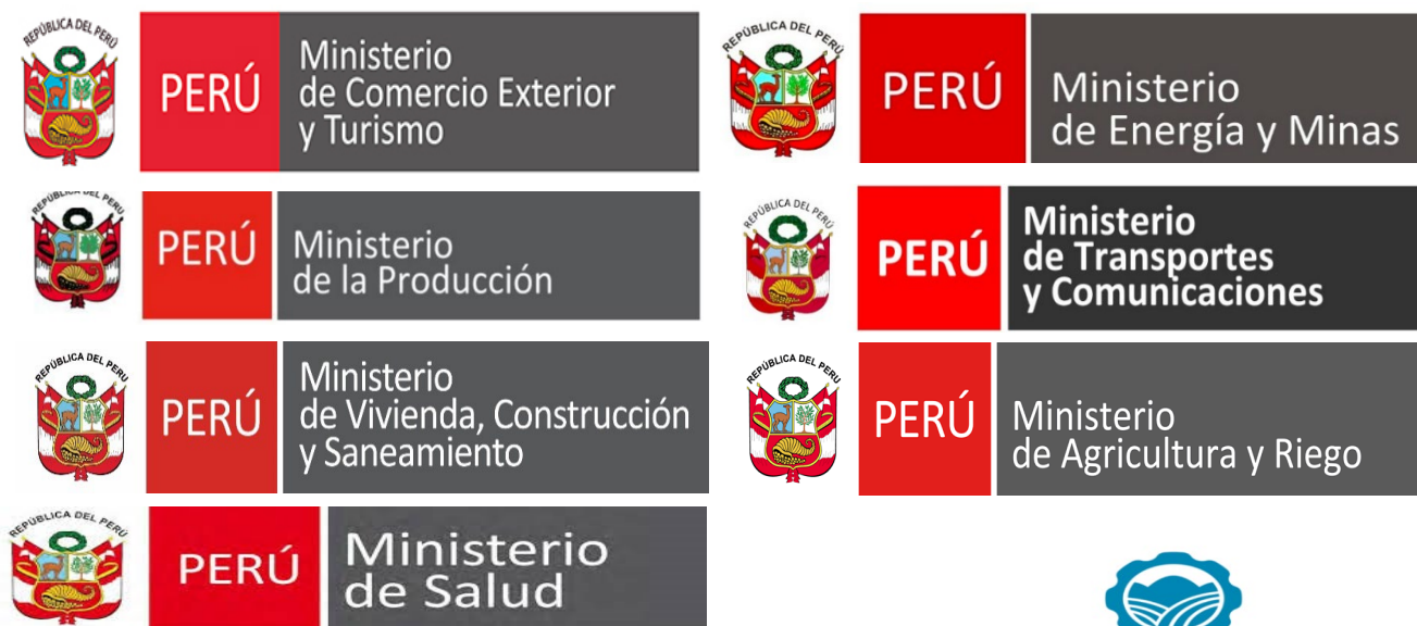
IMAGEN 1 REGISTROS DE GAPASH

Estamos registrados y acreditados para desarrollar estudios ambientales, en los siguientes sectores: