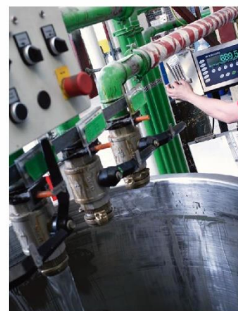
EN LA INDUSTRIA