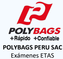
POLYBAGS PERU SAC Exámenes ETAS