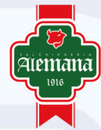
SALCHICHERIAS DE LIMA SAC Exámenes ETAS