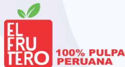
AGRO ALIMENTOS ANDINOS SAC Exámenes ETAS