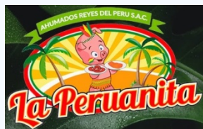
AHUMADOS REYES DEL PERU SAC Exámenes ETAS