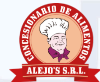
ALEJO'S SRL Exámenes ETAS