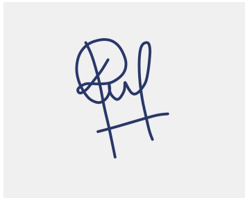
NOMBRE Y FIRMA DEL PERSONAL DE DESCARGA/ CAPTACIÓN