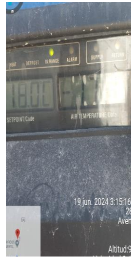
TEMPERATURA DE SALIDA