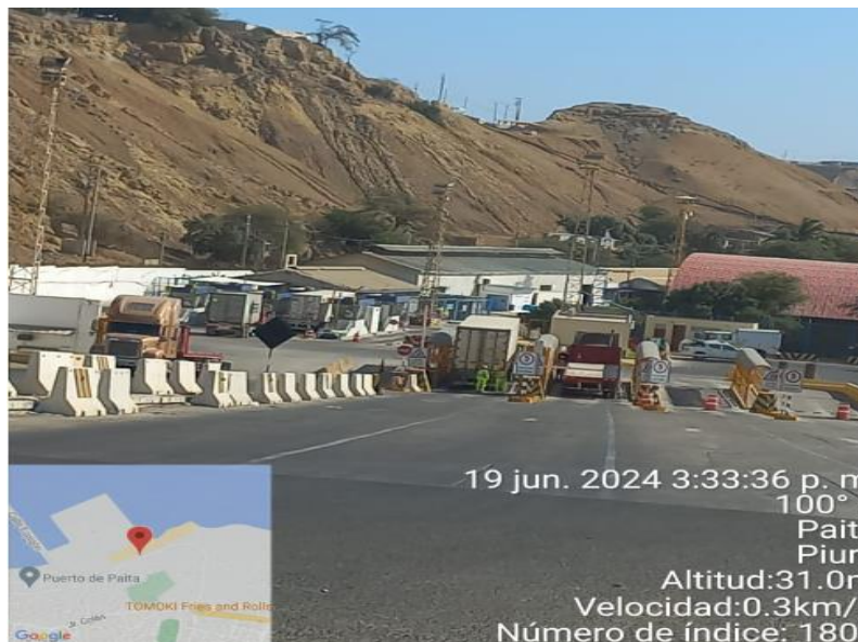
INGRESO A TPE