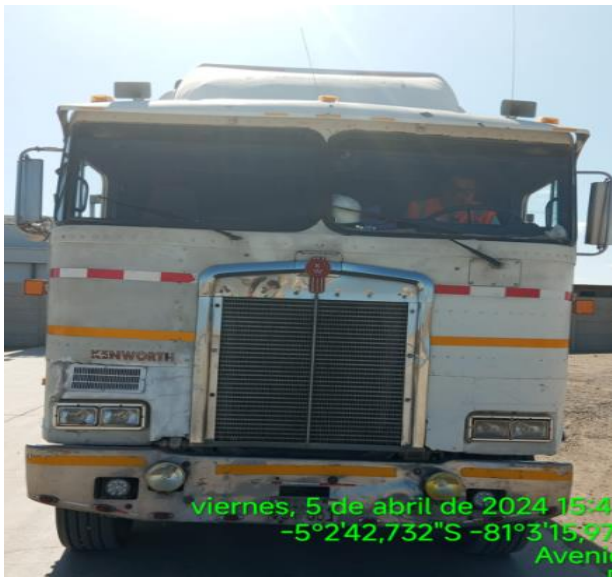
SALIDA DE PLANTA FRIPUSA