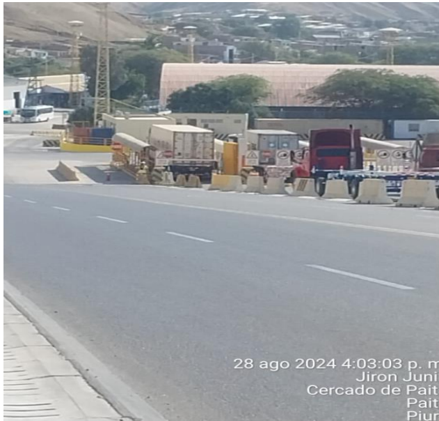
INGRESO A TPE