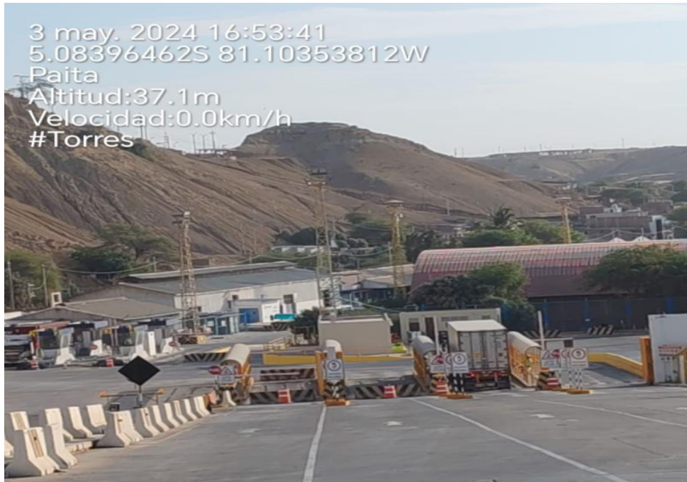
INGRESO A TPE