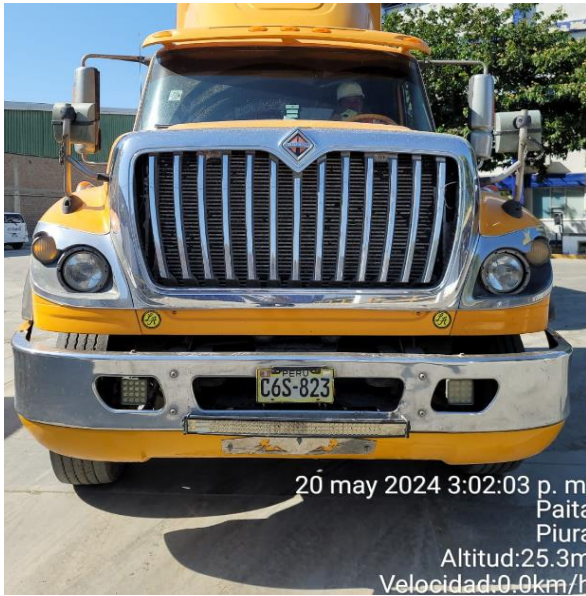
SALIDA DE PLANTA FRIPUSA SAC