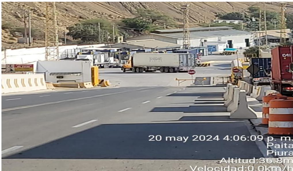
INGRESO A TPE