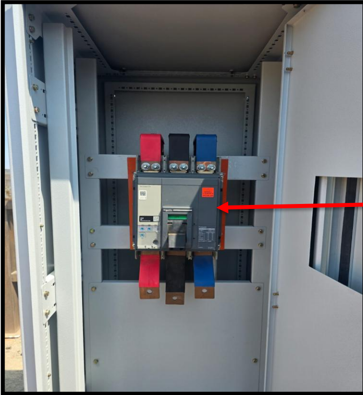
Imagen1: Llave trifásica de caja moldeada empotrado en base metálica de fijación, se dejó con barras de cobre a la salida para la instalación de acometidas de los tableros del Blast freezer y productor de hielo.