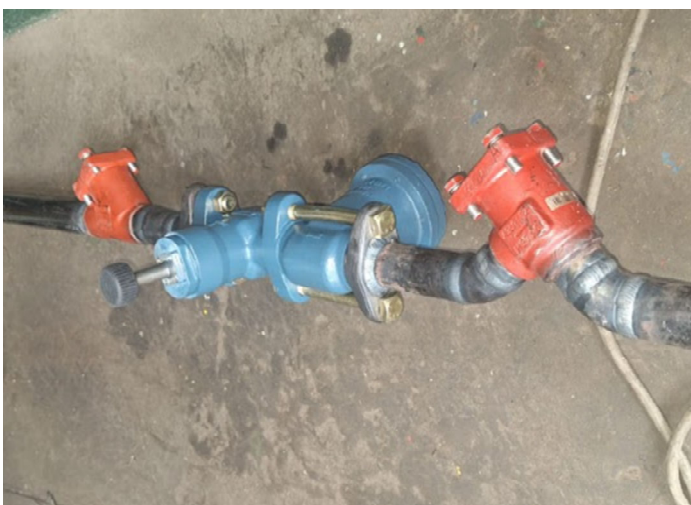
Fig. 1: Fabricación de bypass con válvulas suministradas