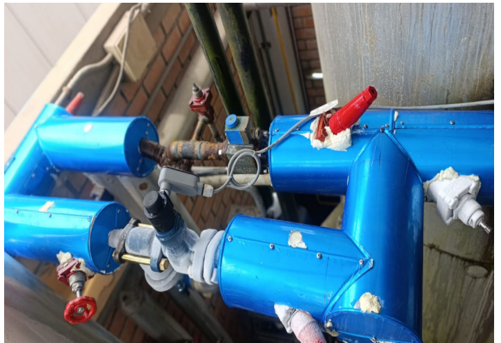
Fig. 2: Aislamiento térmico del paquete completo