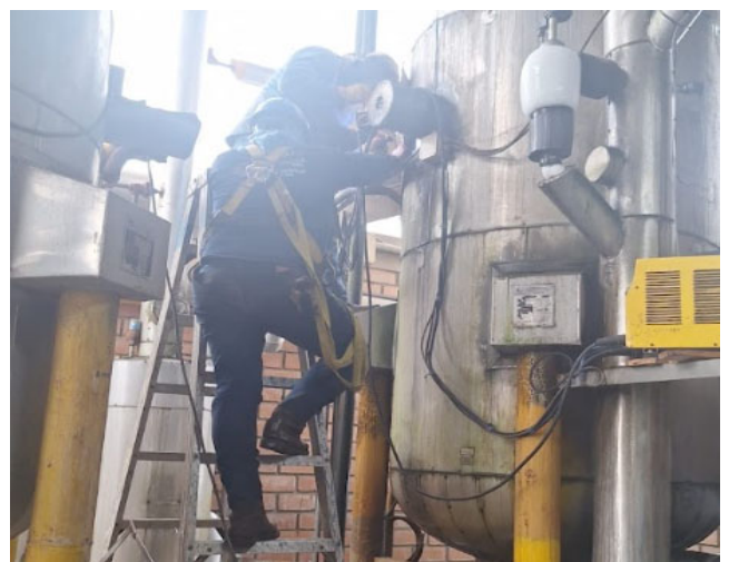
Fig. 2: Instalación de paquete nuevo en tanque.