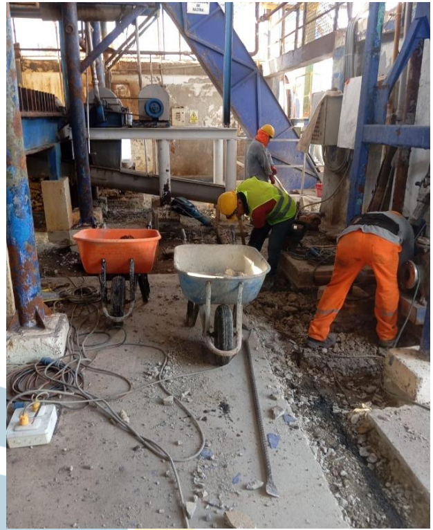
7.- Evidencia del uso de cemento Tipo V y Perfigra &