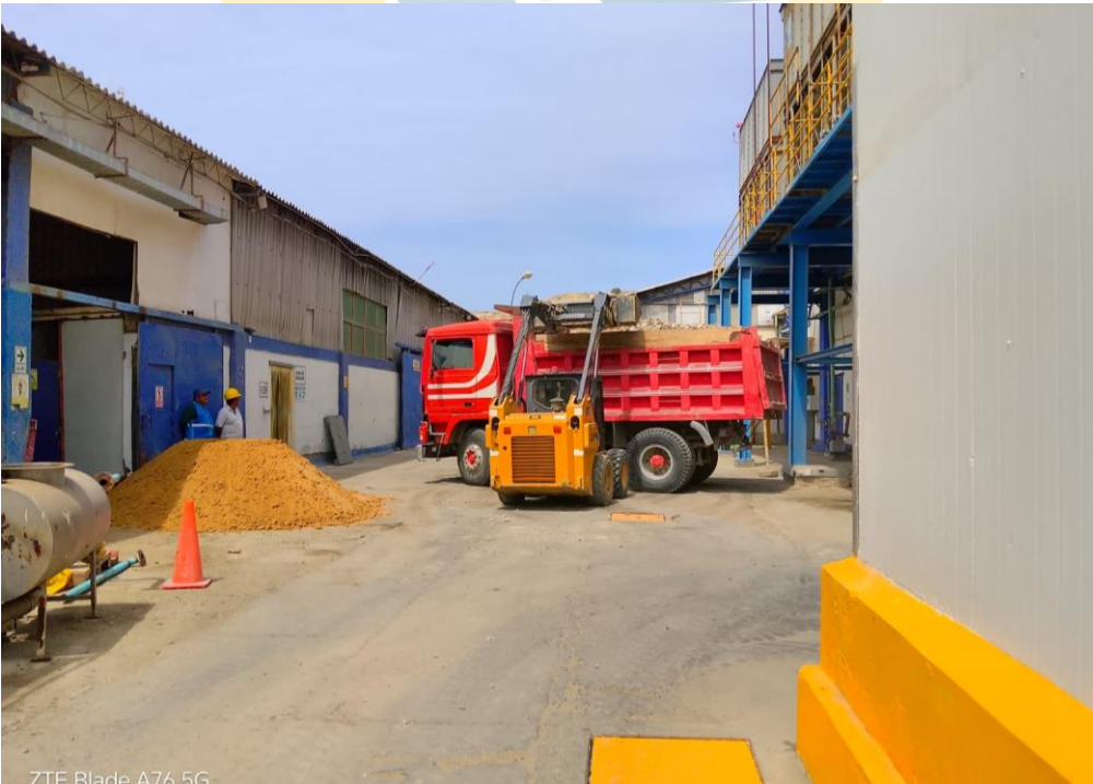
ZTE Blade A76 5G