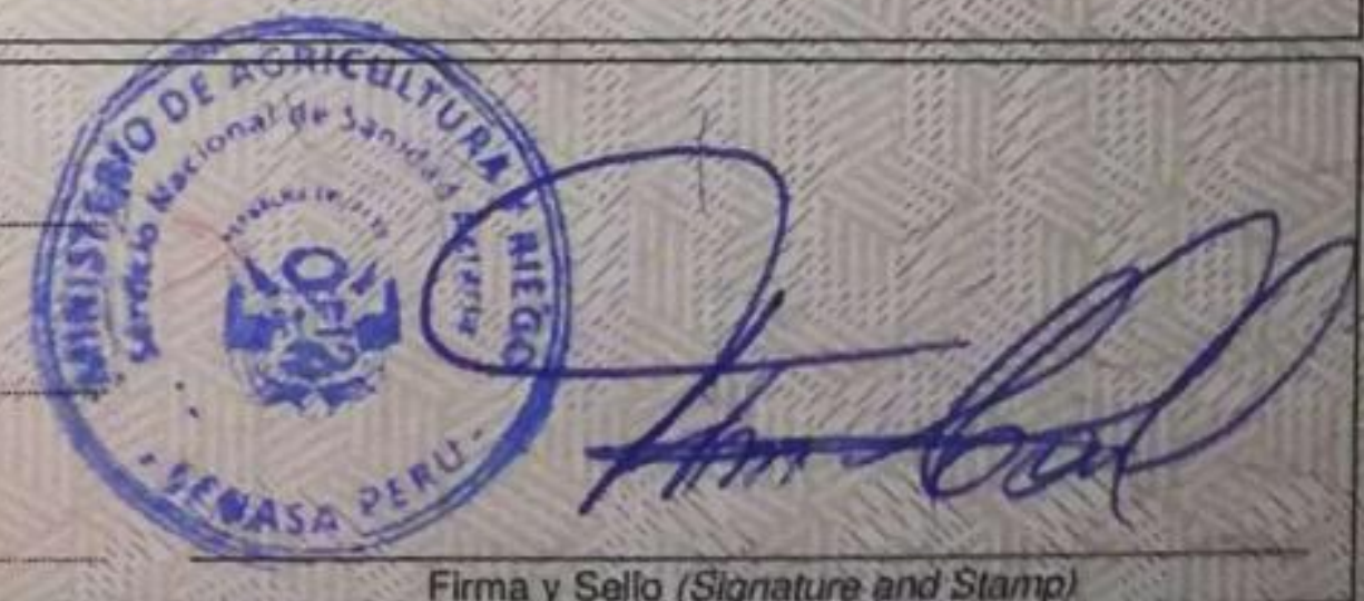
Firma y Sello (Signature and Stamp)