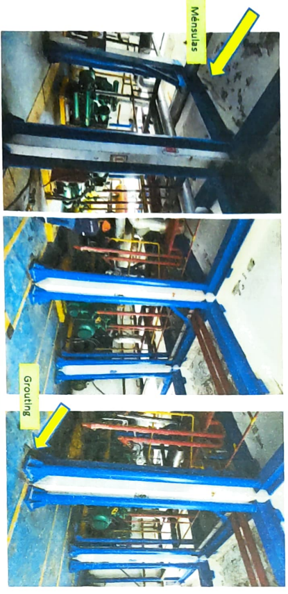
Fotografías de los trabajos adicionales realizados

PRECIOS NO INCLUYEN IGV. SON: Nueve Mil Cuatrocientos Ochenta y Siete con 50/100 Soles. Plazo de ejecución: 15 días calendario