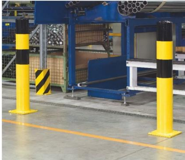
Imagen de mataperros (referencial)

Nota.- NO SE RECOMIENDA QUE LOS MATAPERROS SEAN TIPO ARCO POR EL MISMO MANTENIMIENTO DEL POSTE