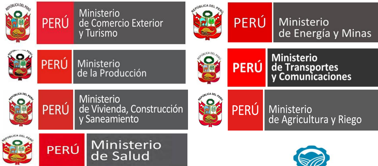
IMAGEN 1 REGISTROS DE GAPASH

Estamos registrados y acreditados para desarrollar estudios ambientales, en los siguientes sectores: