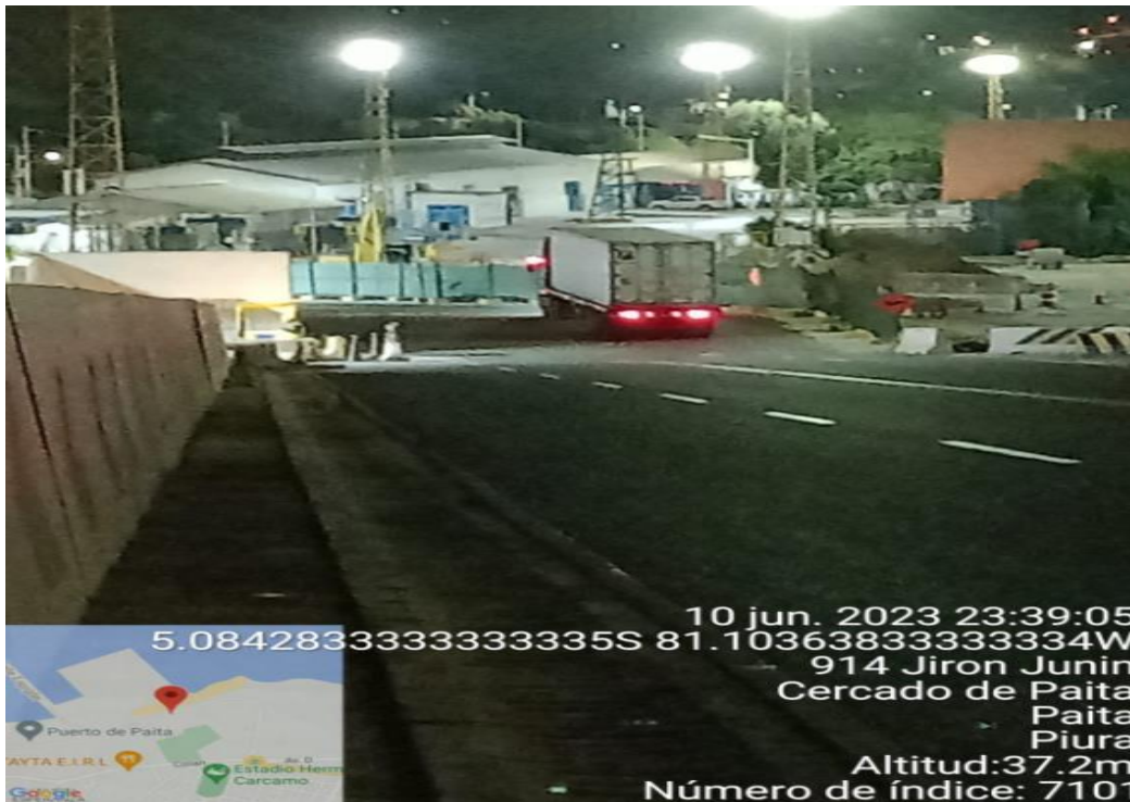
INGRESO A PLANTA TPP