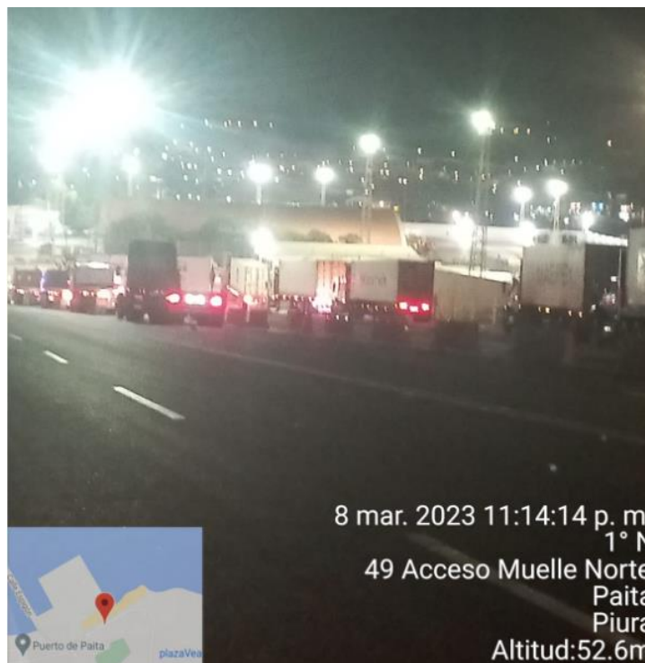
INGRESO A TPE-PAITA