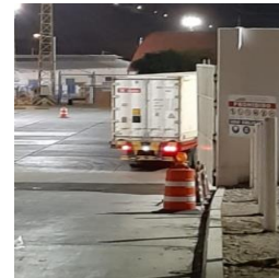
Ingreso a TPE-Paita