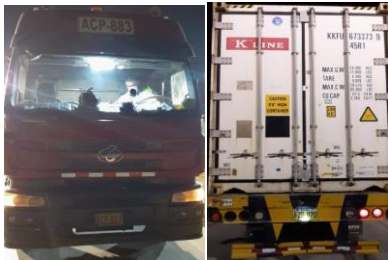
Salida de Planta FRIPUSA