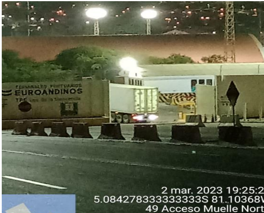
INGRESO A TPE-PAITA