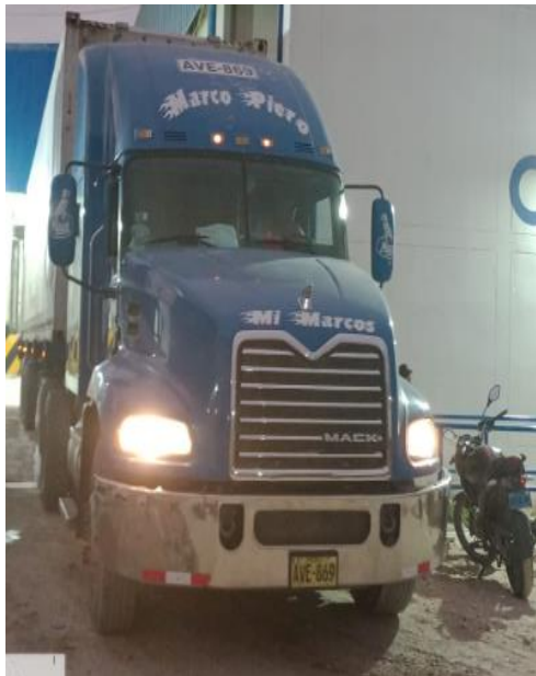
Salida de Planta CETUS