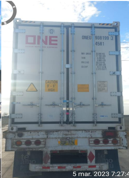
Salida de Planta PL FRIPUSA