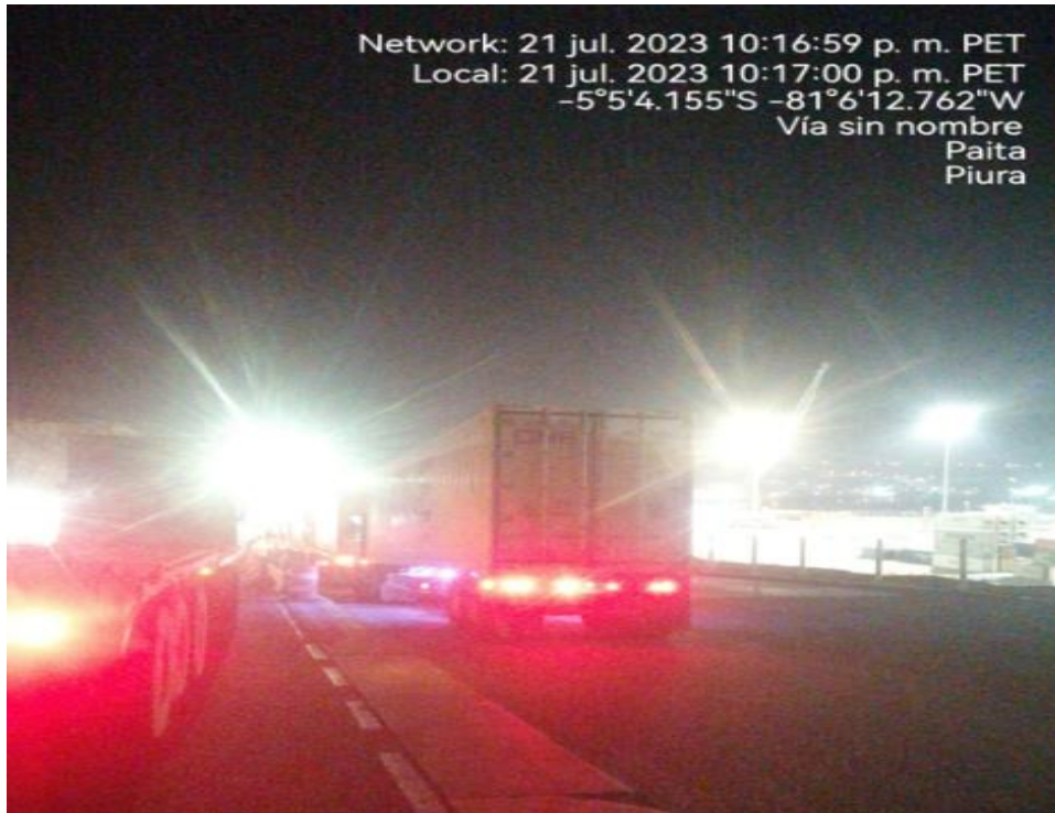
INGRESO A TPE-PAITA