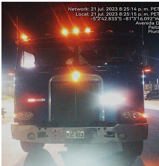
SALIDA DE PLANTA FRIPUSA