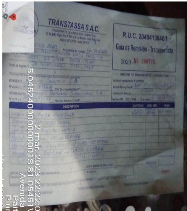
Guía de Transportista