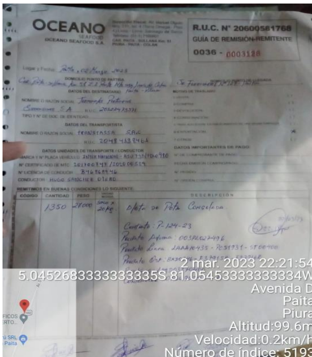
Guía de Remision