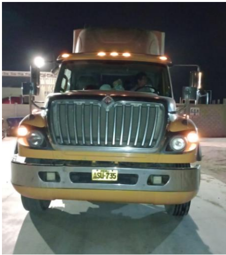
SALIDA DE PLANTA FRIPUSA