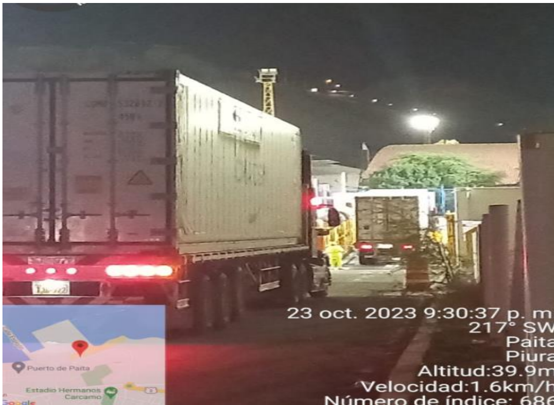
INGRESO A TPE - PAITA