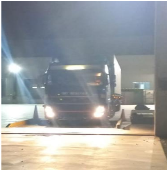
SALIDA DE PLANTA FRIPUSA