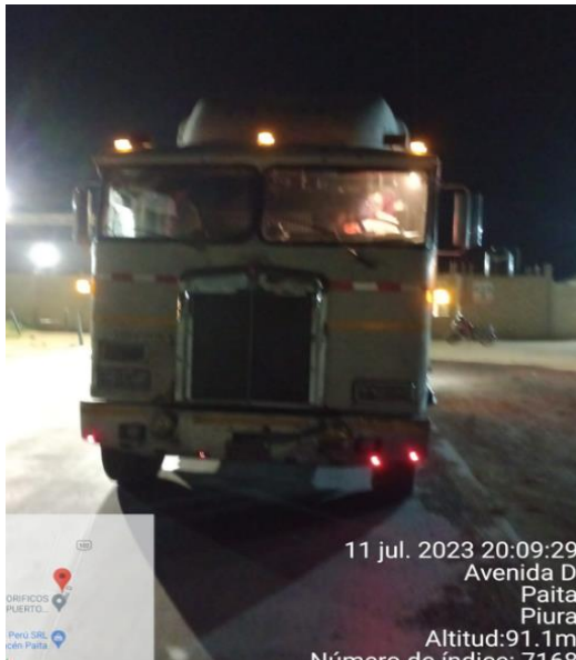
SALIDA DE PLANTA FRIPUSA