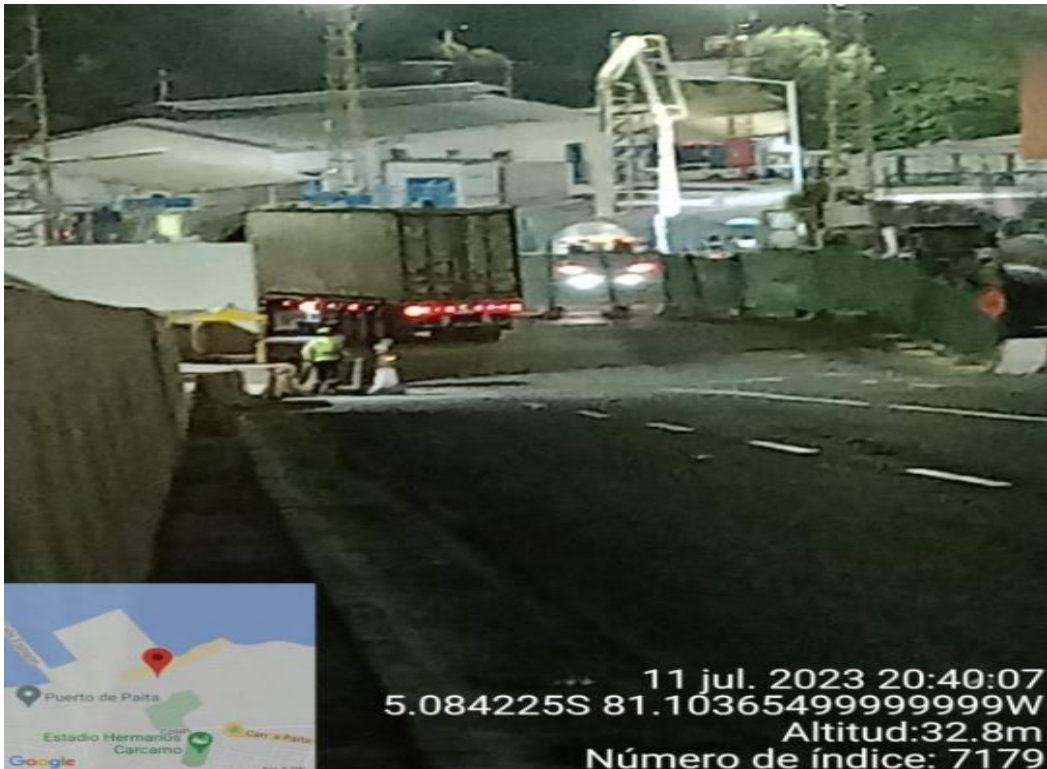
INGRESO A TPE-PAITA