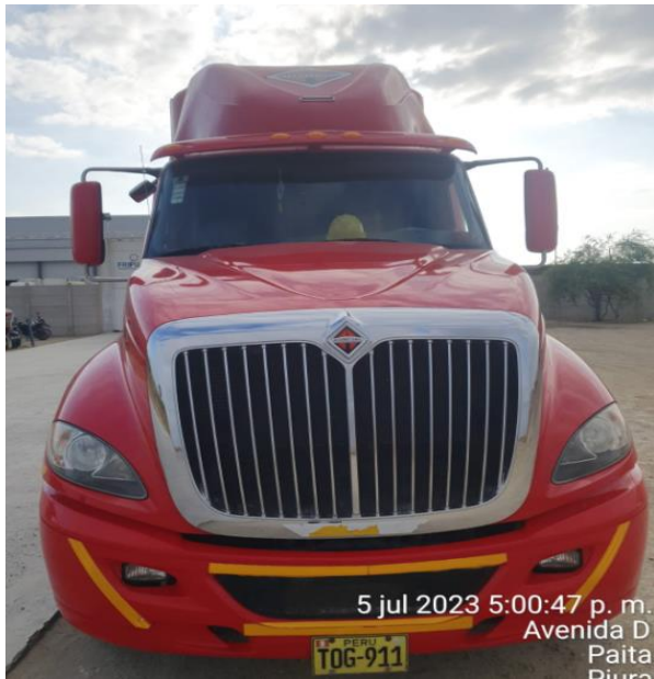
SALIDA DE PLANTA FRIPUSA