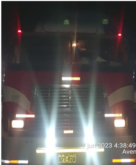
SALIDA DE PLANTA FRIPUSA