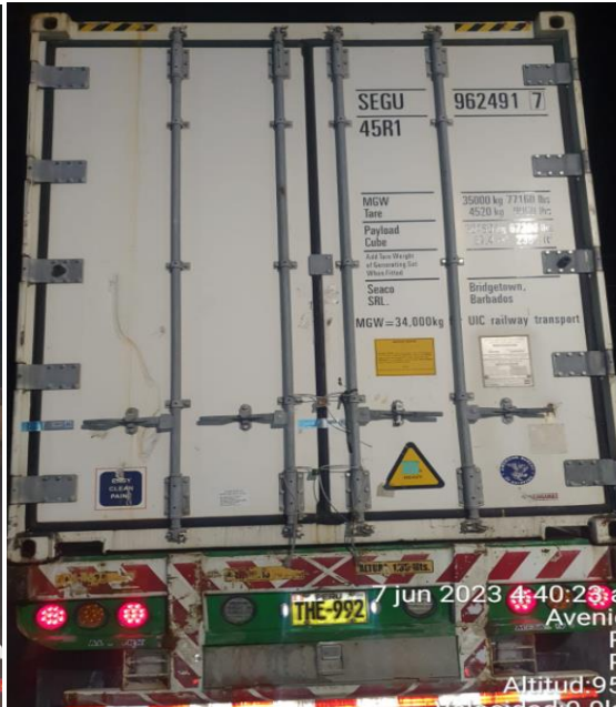
Altitud: 95 Velocidad: 0 km/h