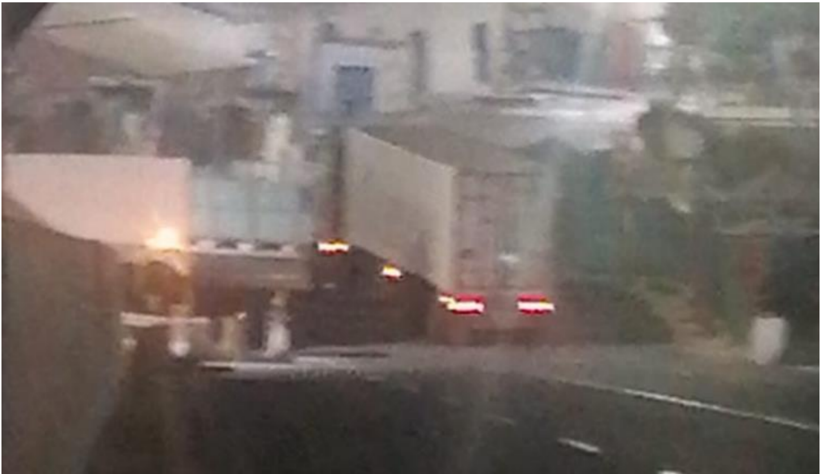
INGRESO DE LA UNIDAD A PLANTA TPE - PAITA