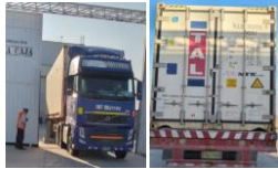
Salida de Planta FRIPUSA