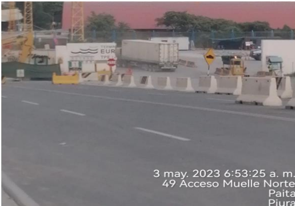
Guía de Transportista

3 may. 2023 6:53:25 a. m. 49 Acceso Muelle Norte Paita Piura