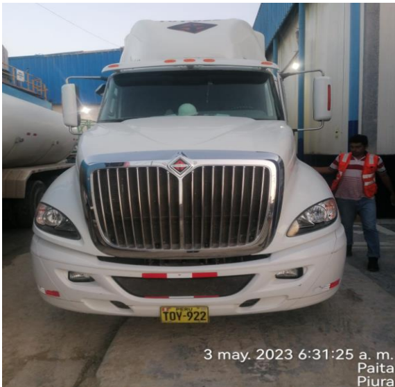
Salida de Planta FRIPUSA